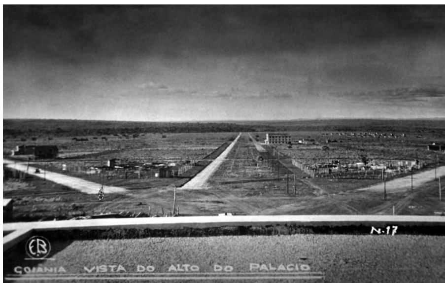
Figura 3. Vista de Goiânia (1937)

Esse hotel foi incluído no plano urbanístico da capital com o propósito de acolher investidores convidados pela administração pública. Parte do projeto urbanístico, a ideia de edificá-lo foi do arquiteto-urbanista Atilio Corrêa Lima, e sua construção ficou a cargo da Coimbra Bueno (ROCHA, D., 2012). Na Figura 3, tem-se uma fotografia de 1937, tirada do alto do Palácio das Esmeraldas – sede do governo de Goiás –, localizado na Praça Cívica.