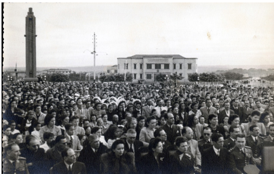
Figura 6. Convidados e populares durante o Batismo Cultural de Goiânia (1942)