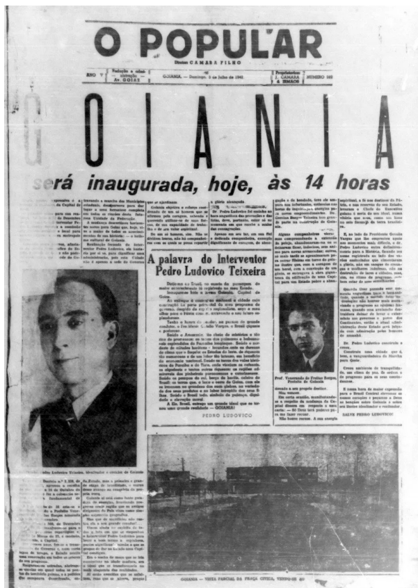
Figura 5. Primeira página de O Popular (1942)

No dia do “Batismo”, o assunto ocupou toda primeira página de O Popular , como se vê na Figura 5.