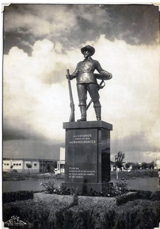
Figura 7. Fotografia do Monumento aos Bandeirantes em Goiânia (1942)