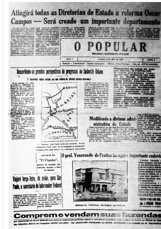
Figura 2. Primeiro número do jornal O Popular (1938)

e dirigido pelo próprio Câmara Filho, 4 e contava com a colaboração de Vicente Rebouças. 5 Consideramos esse jornal um veículo de informação fortemente ligado ao poder político local, uma vez que seus proprietários mantinham laços com Pedro Ludovico desde o Movimento de 1930. Na Figura 2, é possível ver a página do primeiro número do periódico.