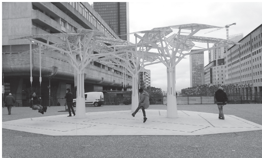
Figura 6: “ Défense de jouer ”, coletivo Nude , Paris

A instalação foi considerada bem-sucedida pelos seus propositores, que tiveram um retorno positivo por parte dos usuários, os quais, por sua vez, paravam surpresos diante da estrutura. No entanto, houve também algumas reclamações por parte dos moradores locais, devido ao barulho provocado pela instalação. A apropriação desse mobiliário não pôde ocorrer de forma espontânea, uma vez que os autores foram obrigados a pôr uma placa especificando proibições, como “não se jogar do balanço”, “proibido animais”, “uma pessoa por assento” etc. A instituição responsável pela bienal pôs câmeras de vigilância e vigias noturnos, que circulavam pelos locais das instalações para evitar possíveis depredações dos mobiliários. O que era para ser um “espaço de liberdade”, segundo os arquitetos, tornou-se em um espaço de restrição.