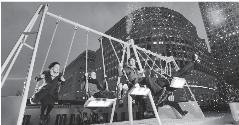
Figura 7: Ação promocional da Évian, em Londres