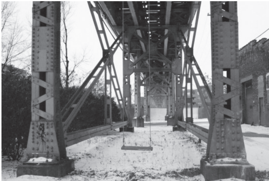
Figura 4: Instalação do Red Swing Project , em Chicago