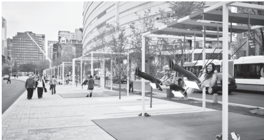
Figura 5 : 21 Balançoires , por Daily tous les jours , Montreal