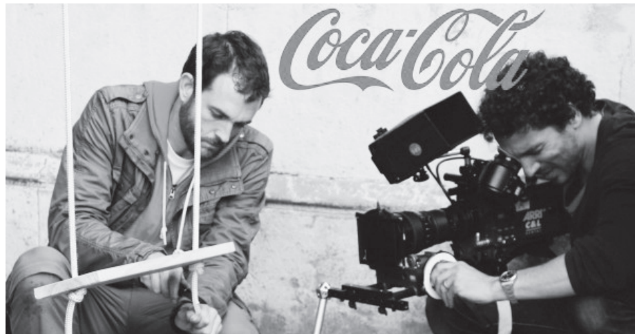
Figura 8: Gravação da campanha da Coca-Cola, em Buenos Aires