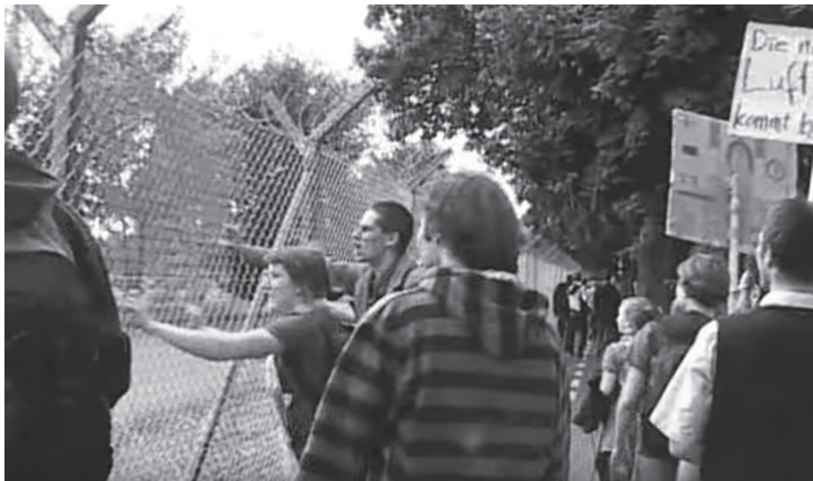
Figura 2: Mobilização para ocupar o aeroporto