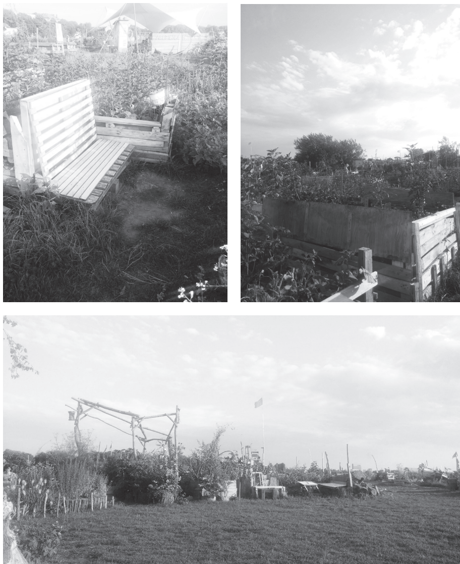
Figura 5: Os jardins comunitários no Tempelhofer Feld