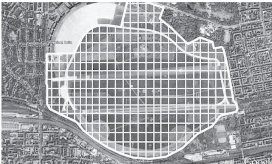
Figura 3: Proposta do jornal TAZ