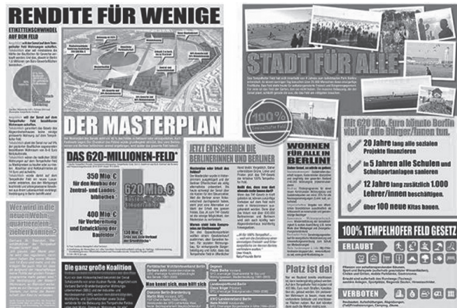
Fonte: Website da iniciativa THF 100% ( kampagnenzeitung ) (THF100%, 2014).

Em maio de 2014, depois de passar pelas etapas burocráticas exigidas para a realização do referendo, 65% dos votos decide pela manutenção da área como um espaço livre e público, interrompendo os planos de construção. A lei traz dois aspectos