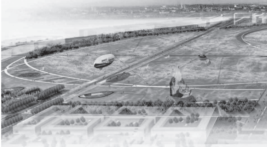
Figura 6: Trecho do plano vencedor do concurso