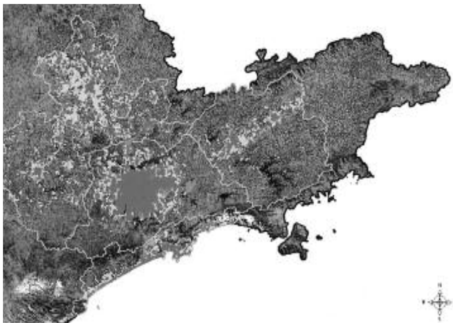
Figura 2 – Fragmento da Megalópole. A mancha urbana maior corresponde à Grande São Paulo; ao norte observa-se a Região Metropolitana de Campinas, e entre ambas encontra-se o Aglomerado Urbano de Jundiá. Mais a oeste, a aglomeração urbana de Sorocaba, já fisicamente conurbada à metrópole campineira, o que ainda não se verifica entre Sorocaba e São Paulo. A leste, a intensa urbanização do Vale do Paraíba.

A ligação física entre São Paulo e Rio de Janeiro é mais forte pelo vetor urbano-industrial do Vale do Paraíba; mas também pelo litoral, pela BR 101, se observa uma forte apropriação urbana do território ligada, principalmente, ao lazer.