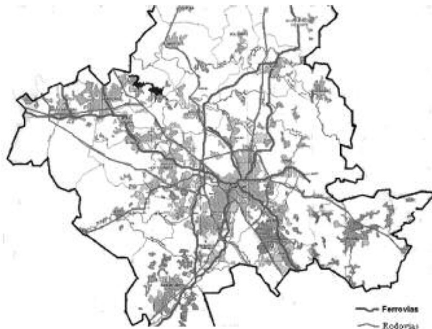
Figura 3 – A urbanização da Região Metropolitana de Campinas. Atente-se para a excessiva fragmentação da mancha urbana. (Desenho: Queiroga, 2007; base: Bitencourt, 2004)